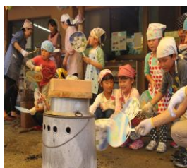
お釜でのごはん炊き

らいおん・ぞう組が、園の横を流れている辛沢川で川遊びをしました。川に住んでいるサワガニや川魚のカワムツ・ヤゴを見つけ大喜びの子ども達でした。この夏は、とても貴重な経験をしました。