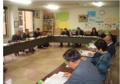
写真は、役員研修会に参加する理事・監事の皆さん 平成二十二年三月 福井県大野市シルバー人材センターにて