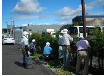
剪定講習の様子 平成二十二年九月

多治見市高齢者能力開発研修センター主催 剪定、襖・障子貼り、パソコン講習 ご案内