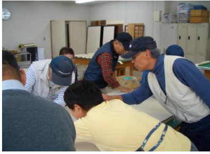
襖・障子貼りの講習の様子 平成二十二年十月

多治見市高齢者能力開発研修センターでは、 毎年二回、剪定初級、襖・障子貼り、パソコン 初級の講習会を開催しております。