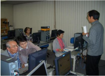
パソコン初級講習の様子