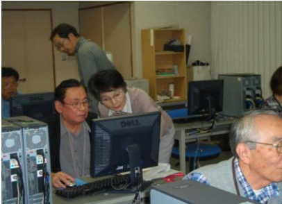
平成二十二年十月